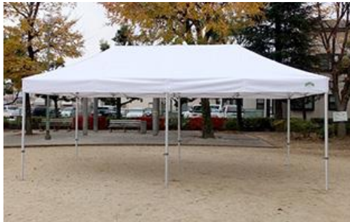
〈レクリエーション用品 1 式〉