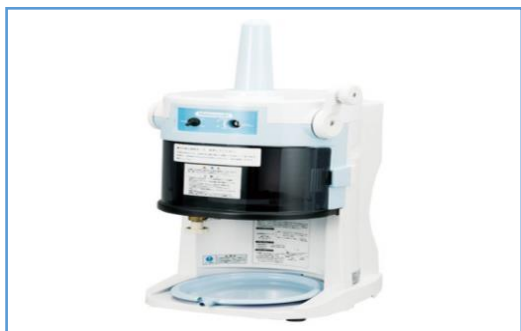
〈業務用かき氷機 1台〉