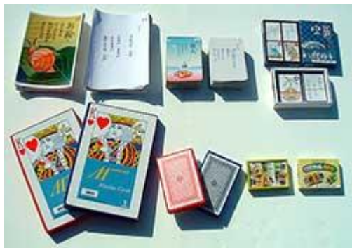
〈レクリエーション用品 1 式〉