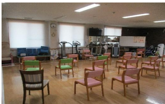
〈デイサービスフロア〉