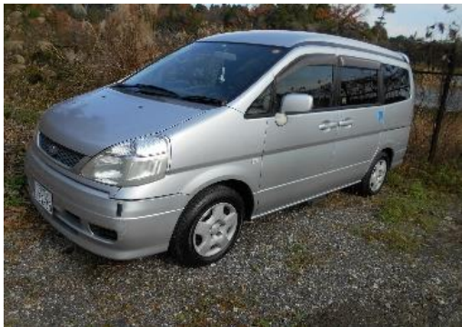
〈ワンボックスカー1台〉