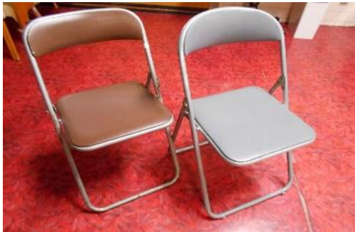
〈パイプ椅子 50 脚、椅子 20 脚〉