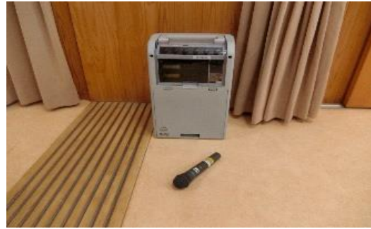
〈マイクスピーカーセット1組〉