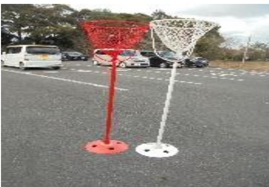
〈運動会用具（玉入れ）〉