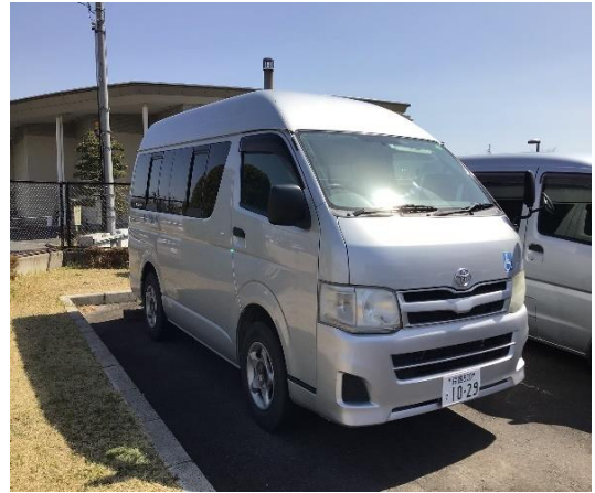
〈ワンボックスカー1台〉