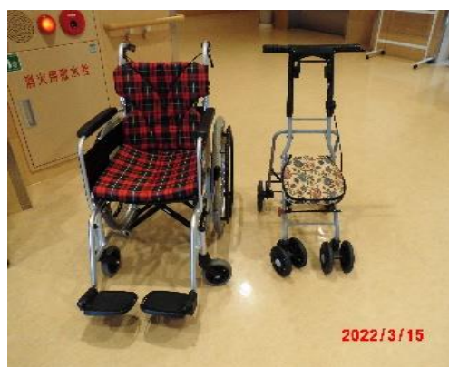
〈車いす3台、シルバーカー3台〉