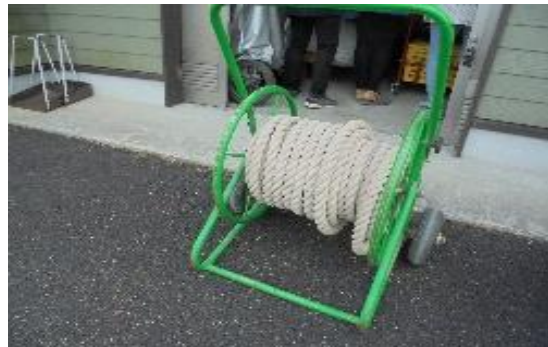
〈運動会用具（綱引きの綱）〉