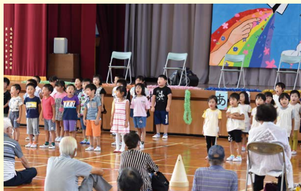
<ふれあい交流事業>