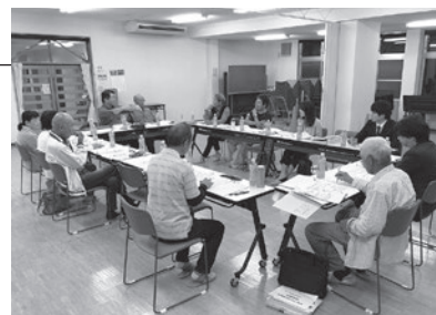
井田川北ささえ愛たい立ち上げ支援