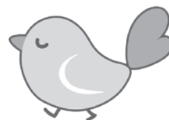
認知症初期集中支援チーム イメージキャラクター「かなりん」