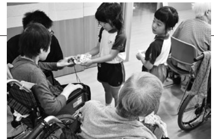
園児による高齢者施設訪問・交流