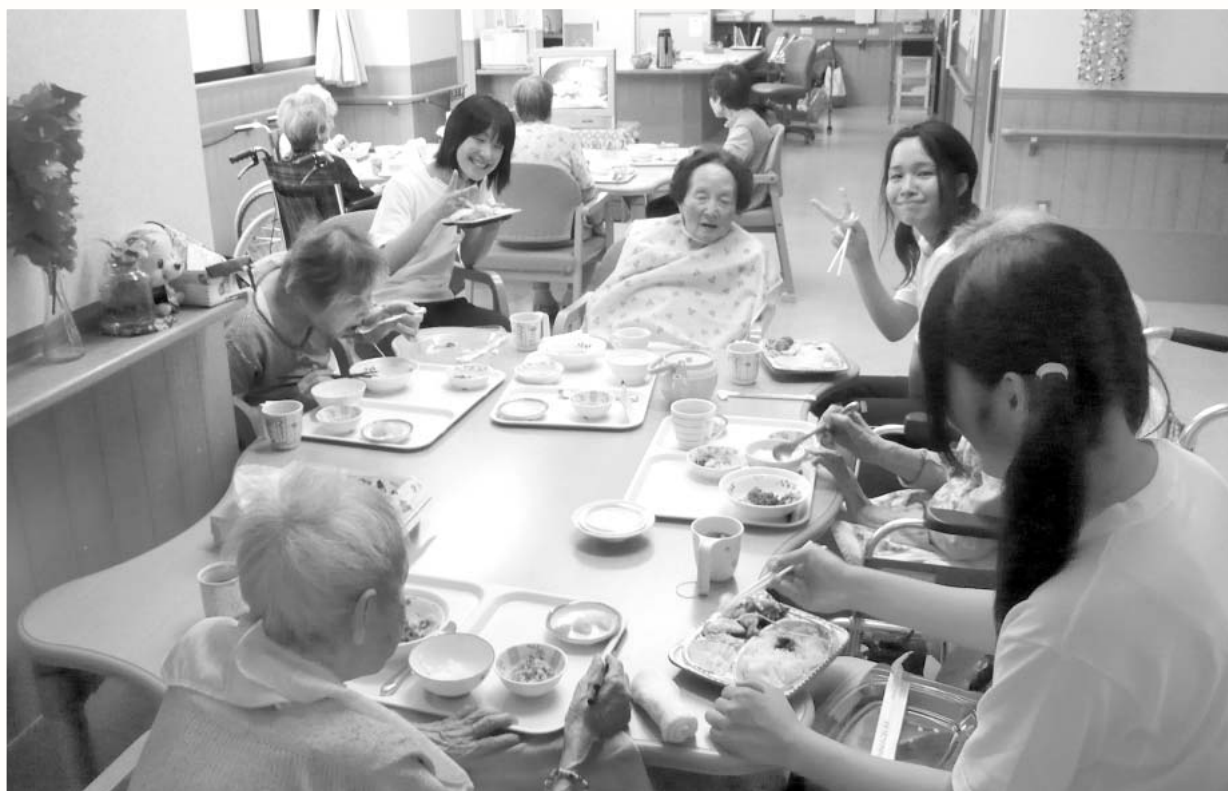
利用者さんと楽しくお食事♪ (亀寿苑)