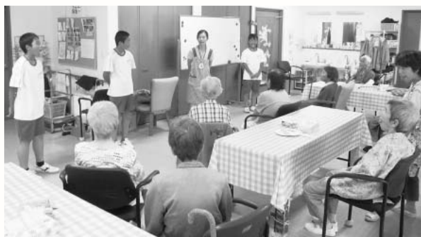
皆さんと一緒に食事前の嚙下体操 (うさぎ亀山)